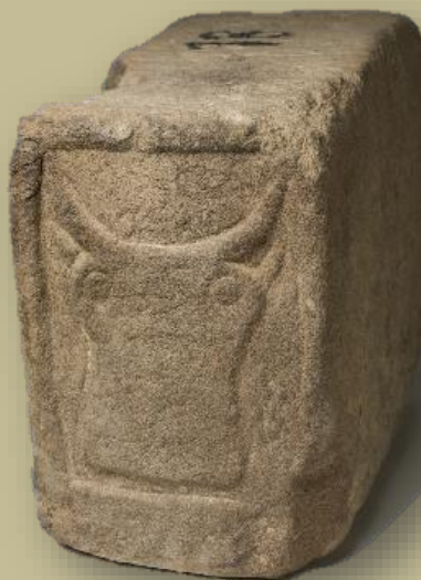
Sos del rey Católico Taurobolio aldarea

Zezenaren buruak lerro gurutzatu batzuk ditu animaliairen aurpegiaren gainean, maskara edo oihal batez estaliko balu bezela. Adarrak oso garatuak eta ia angelu zuzenean ditu, begiak berriz, bi zulo sakonez nabarmenduak. Eskubiko belarria markatuagoa dago, buruaren alde horretako adarra bezala. Ezkerreko aldea berriz, leunduagoa nabari da.