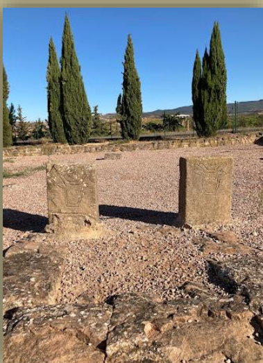
“La Villa de las Musas de Arellano”-ko Tauroboliko izaerako aldareak