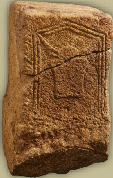
Elexazarreko Taurobolioa (Amurrio)