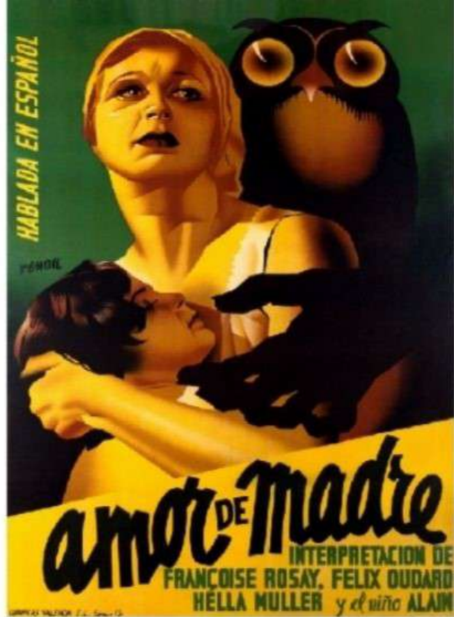
Amor de madre Renau. 1935

La exposición Carteles de cine en Bilbao , comisariada por Ignacio Mitxelena Usatorre y Bernardo I. García de la Torre, presenta, por primera vez reunida, la obra de los doce diseñadores españoles de afiches cinematográficos más relevantes en el periodo 1935-2000, que fueron vistos en Bilbao.