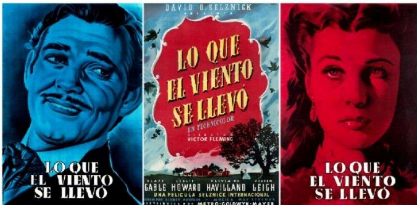
Lo que el viento se llevó MCP 1939