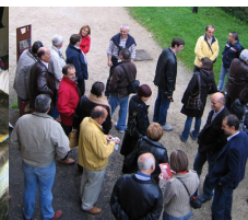
Taller de talo