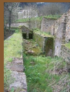
Antepara de Bolunburu

◆ Incorporamos a la oferta educativa el recorrido guiado por las ferrerías de La Olla y Valdivián para los grupos escolares (curso 2010/11).