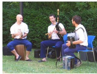
Folk & Fire en El Pobal