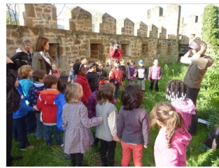
Los peques en el Castillo