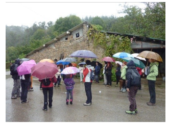
Ferrería de Valdivián (JEP)