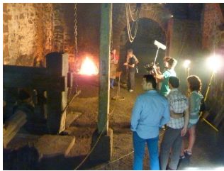
La Ferrería en ETB